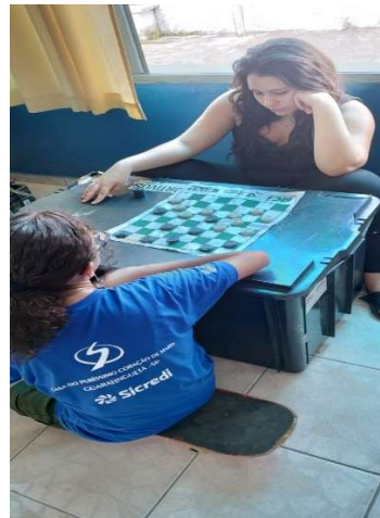
Oficina de Esportes