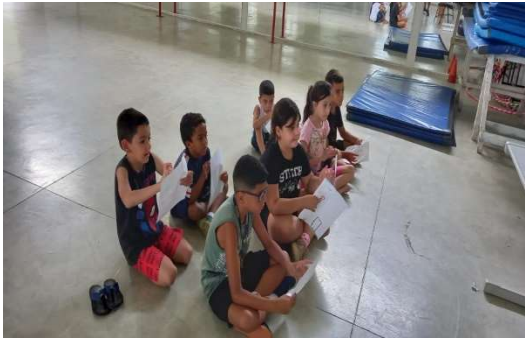
Oficina de Cultura e Musicalidade