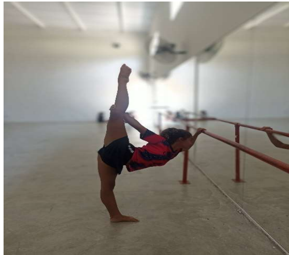
Oficina de Ginástica Rítmica