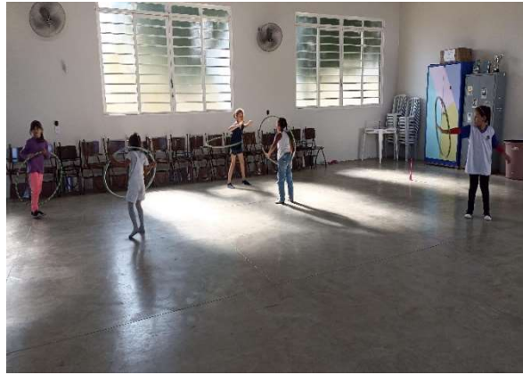
Oficina de Ginástica Rítmica