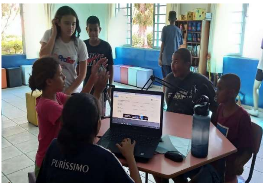
Oficina de Educomunicação