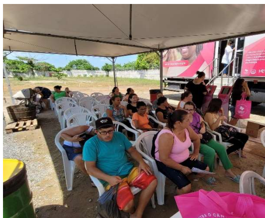
Carreta de Mamografia