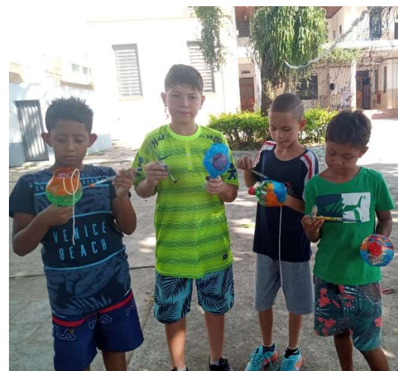
Oficina de Educação Socioambiental

IMPACTO SOCIAL: Capacidade de demonstrar emoção, autocontrole e de interação no processo de fortalecimento de vínculos interpessoal, institucional, familiar e comunitário, tais como: Ser forte; comunicativo; desenvolver novas habilidades sociais, culturais e artísticas; diminuição de conflitos pessoais e/ou em grupo; realização de tarefas coletivas. Redução das expressões de vulnerabilidades sociais presentes no cotidiano das crianças e adolescentes atendidos.