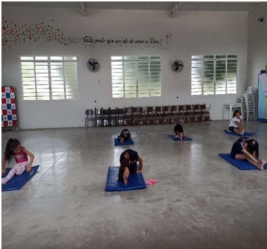
Oficina de Ginástica Rítmica