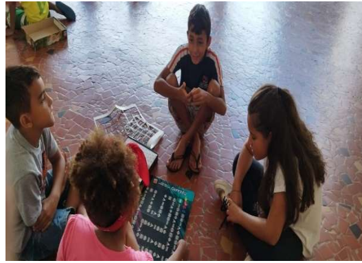
Oficina de Esportes