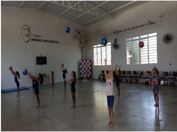
Oficina de Ginástica Rítmica