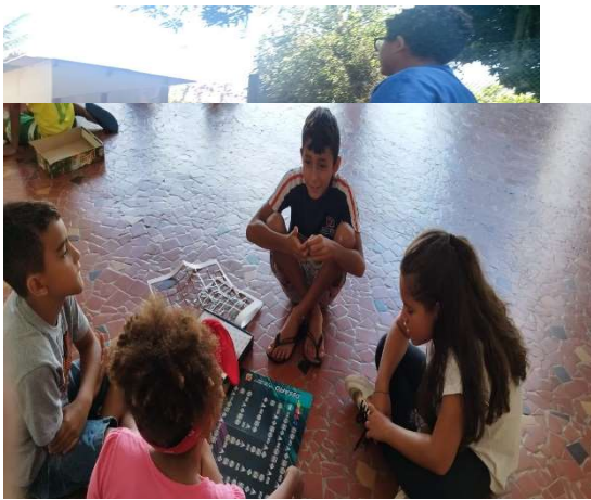
Oficina de Educação Socioambiental