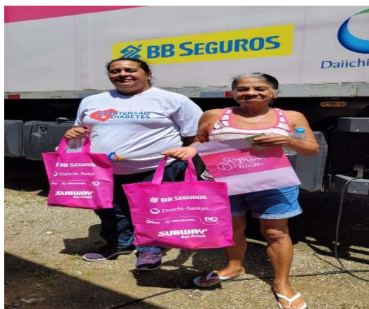
Carreta de Mamografia