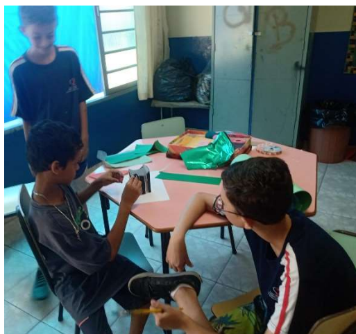
Oficina de Educação Socioambiental