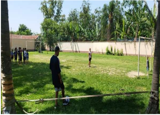
Oficina de Esportes