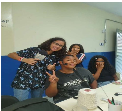
Oficina de Educomunicação