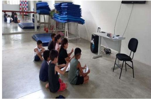
Oficina de Cultura e Musicalidade

OBJETIVO ESPECÍFICO: Articular junto a rede socioassistencial, dos demais órgãos e das demais políticas públicas.