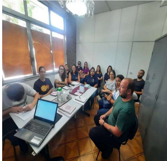
Reunião Gestão de Parcerias

OBJETIVO ESPECÍFICO: Oportunizar o acesso às informações sobre direitos e sobre participação cidadã, estimulando o desenvolvimento do protagonismo dos usuários.