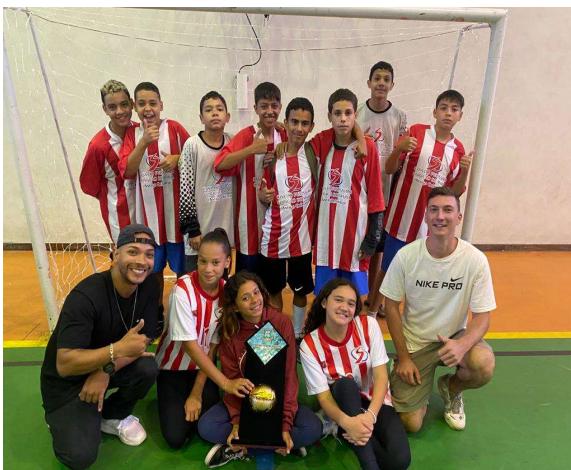
Oficina de Esportes