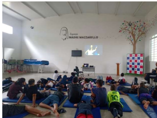
Oficina de Educação Socioambiental