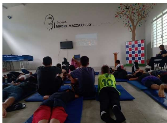
Oficina de Educomunicação